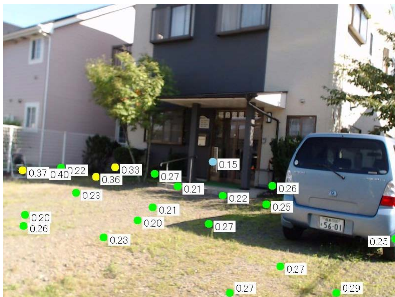
「ホットスポットファインダー」を用いて、福島聖書教会の除染後の庭を計測

そこで、福島県キリスト教連絡会（FCC）は、「ホットスポット・ファインダー」という最新機器を購入しました。私たち東北ヘルプもそのお手伝いをしました。この機械によって、ホットスポットを細かく調べることができるようになったのです。たとえば通学路などに高い放射線量が確認される。すると、それを行政や地域自治会に連絡し、その場所を除染して、放射線を遮蔽し、子どもたちを守ることができるかもしれない。そうした試みが始まっています。