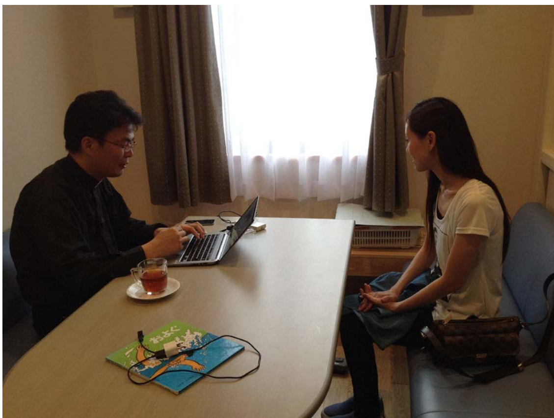
日本基督教団 常磐教会を会場に行われた短期保養面談の様子。

私たち東北ヘルプは、日本基督教団常磐教会、任意団体「福島 HOPE」、日本バプテスト連盟郡山コスモス通り教会、等と連携し、 主にいわき市と郡山市の656世帯（2012年7月～2014年10月まで・累計）の短期保養 を支援しました。