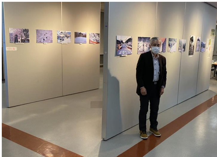
2022年2月23日 仙台にて開催の「飛田晋秀 写真展」会場。現地の最新の写真と共に、飛田晋秀先生

福島県浜通りの原発周辺は、広く「帰還困難区域」が設定され、その住民は避難を余儀なくされました。その「強制避難地域」に、今、人が戻りつつあります。